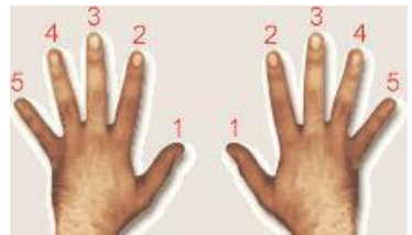
Dedos numerados Respetar el dedo en la tecla

Posición de los dedos en las teclas blancas: do re mi fa sol